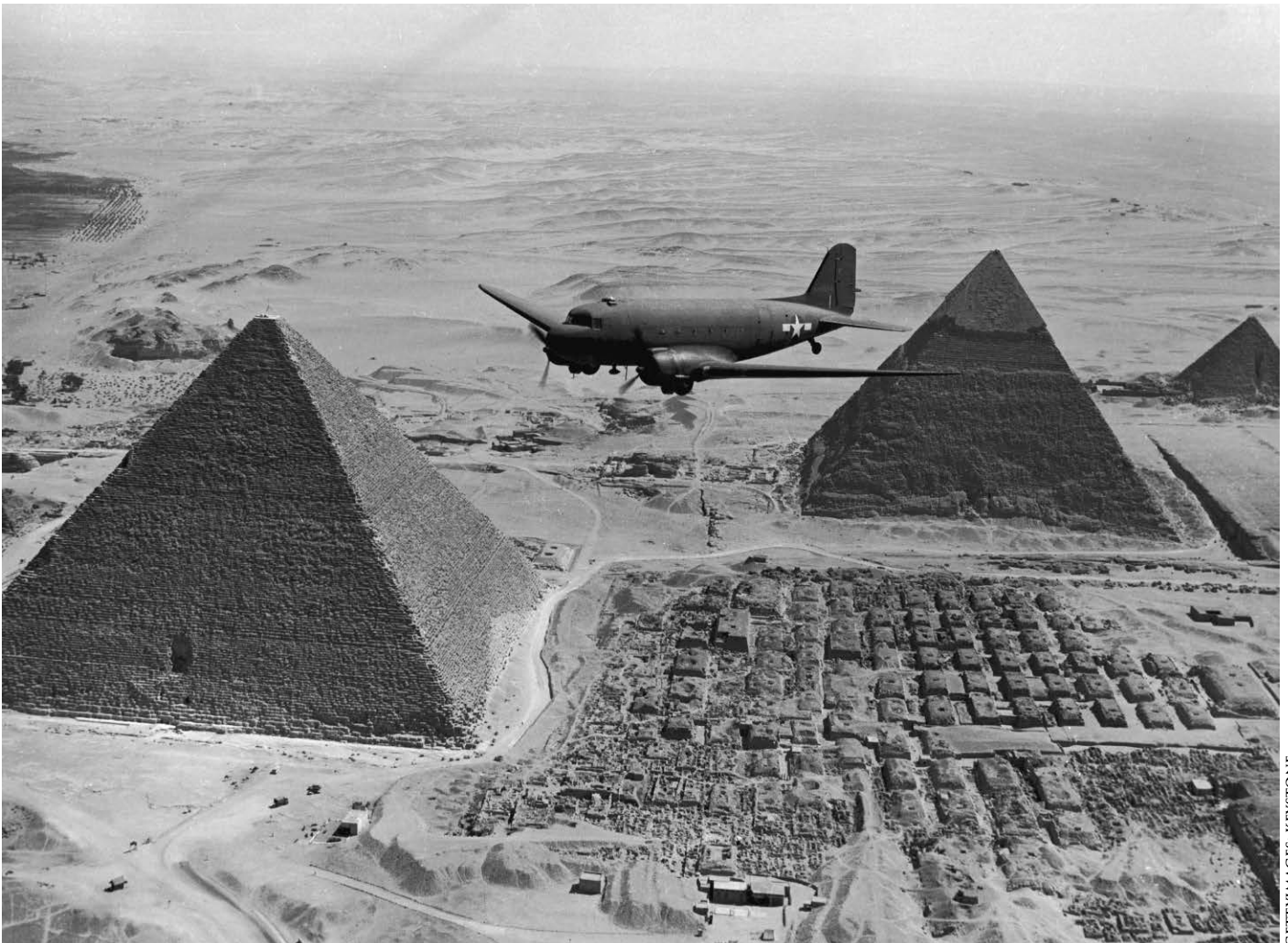
Ett militärt transportflygplan från USA ovanför pyramiderna. Giza, Egypten, 1943.