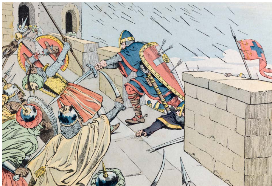
Godfrey of Bouillon intar Jerusalem i juli 1099 med sina korsriddare.

6. Vilka blev konsekvenserna av korstågen på kort sikt och på lång sikt? _____ _____ _____ _____ _____ _____ _____ _____ _____ _____