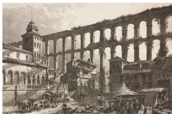
Segoviaakvedukten. Tavla från 1844.

Aphrodisias (Turkiet) Bath, ett romerskt bad (England) Celsusbiblioteket i Efesos (Turkiet) Colosseum (Rom) Hadrianus mur (England) Forum Romanum (Rom) Latrinae publicae i Ostia (Rom) Pompeji (Italien) Pont du Gard (Frankrike) Pula, en amfiteatern (Kroatien) Segoviaakvedukten (Spanien) Timgad (Algeriet)