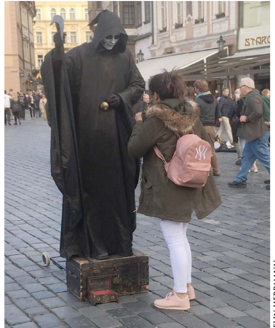
Efter digerdöden liknades döden vid en lieman - ett skelett i svart kåpa med en lie i handen som skördade sina offer.

6. Ange en av dina källor och motivera varför just den källan är trovärdig. Läs om trovärdighet på s. 244-245 i läroboken om du vill.